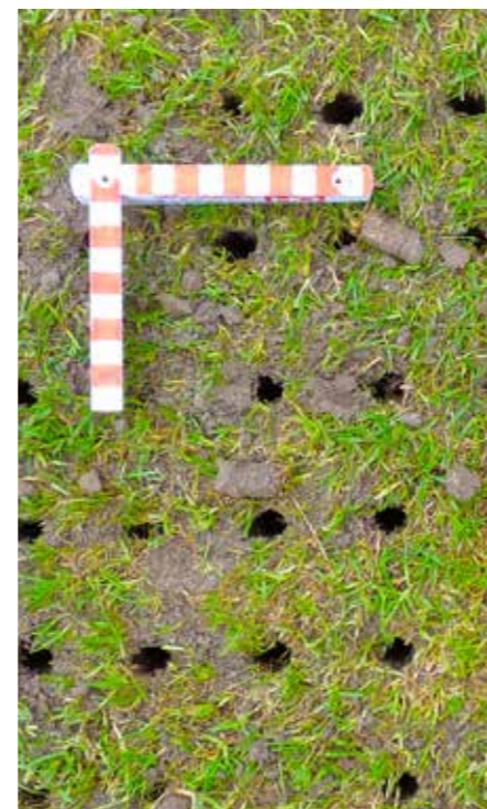
Tiefenlockerung (ob.) und Aerifizierung mit Lochbild.

Beide Bodenbearbeitungsmaßnahmen erfolgen mittels Spezialgeräten. Die Tiefe und Anzahl der Löcher oder Schlitze wird auf die jeweiligen Bodenverhältnisse individuell angepasst.