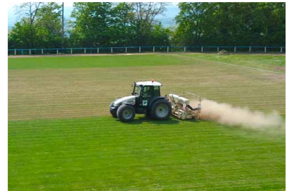
Rasenregeneration mit Aeriforce-Gerät.

Fast alle Maßnahmen einer Regeneration erfordern den Einsatz von Spezialmaschinen, die für den Platzwart oft nicht verfügbar sind. Rufen Sie uns an!