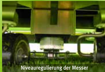
Niveauregulierung der Messer