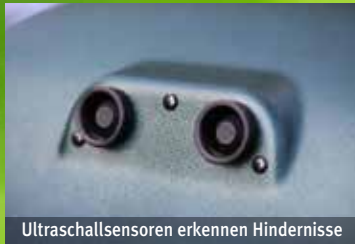
Ultraschallsensoren erkennen Hindernisse