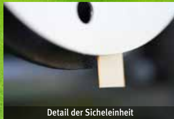
Detail der Sicheleinheit