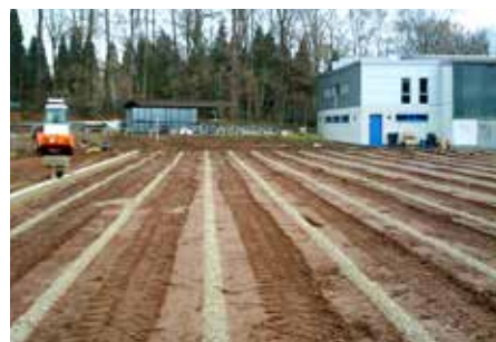
Verfüllung der Sickerschlitz